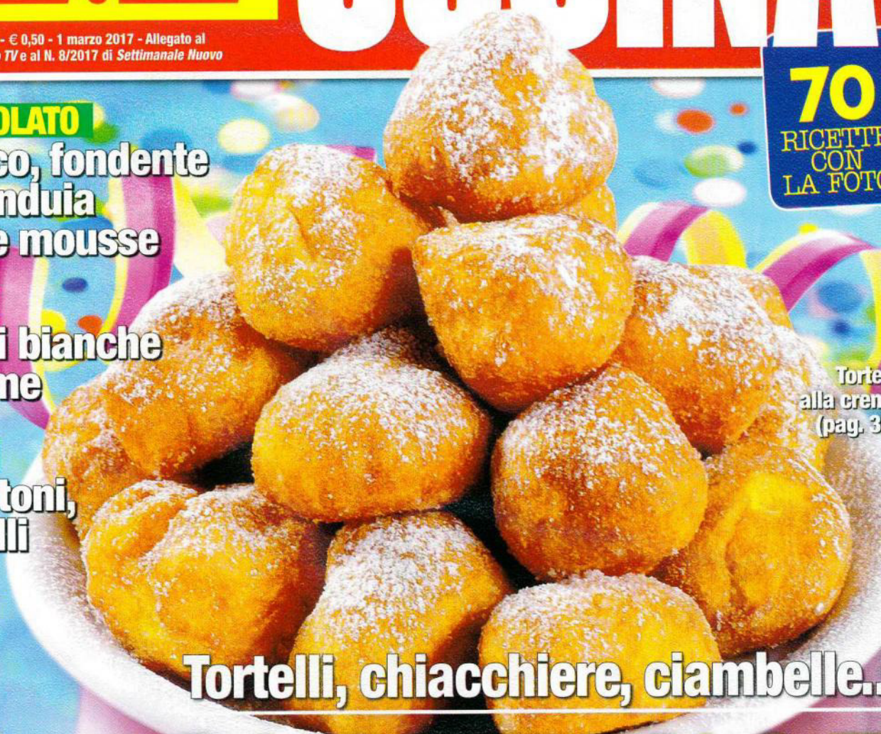
Tortelli alla crema (pag. 35)